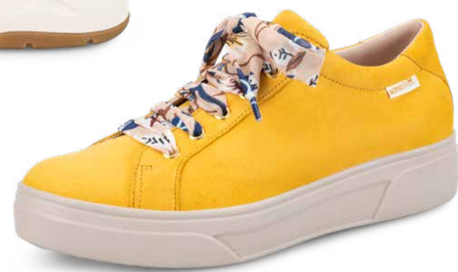
FANYA SILK •